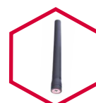
Antena TX680ANTV TX680ANTU

Precios de Lista sugeridos al público. No incluyen IVA.