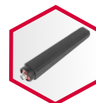
Antena TX500ANT TX600ANT