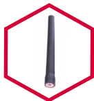
Antena TX680ANTV TX680ANTU